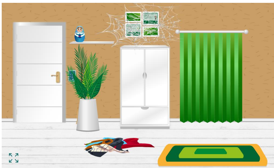
Рисунок 2. Веб-квест на образовательной платформе Learnis «Эксперты реставраторы»

Перед игроками лист с размытым текстом статей Конституции Республики Беларусь, которая случайно пострадала от потопа в библиотеке. Задача – восстановить текст, заполнив пропущенные слова. За каждое восстановленное слово участники получают 1 балл.